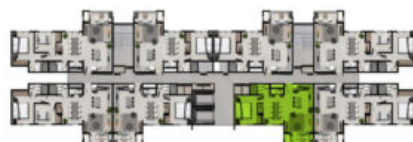
VISTA AL MAR