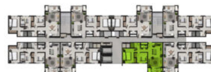
VISTA AL MAR